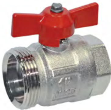
Шаровой кран «бабочка»